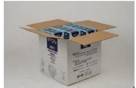
Einzel verpackt EAN