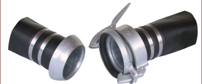
Kupplung System Perrot

zertifiziert nach DIN EN ISO 9001 : 2008 Qualitätsmanagementsystem